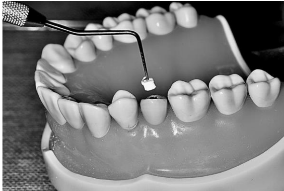
Bastão de PTFE sendo introduzido

Vista do parafuso do acesso ao parafuso de prótese sobre implante